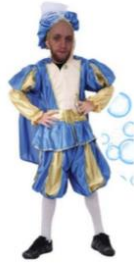
Mister Matt is Cinderello