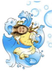
Miss Kate is the Wish Fish