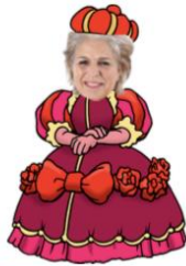
Miss Angelique is the queen on Monday and Tuesday