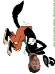
In the morning, Mister Jeremy is the wolf