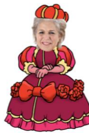
Miss Angerika is the queen on Monday and Tuesday

Op een dag werd de prinses ziek. Ze hoestte heel akelig. Daarom vroeg Roodkapje's moeder aan Roodkapje of ze wat lekkers naar de prinses wilde brengen zodat ze weer snel beter zou worden. Dat wilde Roodkapje natuurlijk wel en ze ging op weg met haar mandje en de koekjes. Onderweg kwam ze langs een vijver en ze besloot een vis te vangen. Want vis is heel gezond en zo zou de prinses snel weer beter worden.