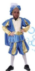
Mister Matt is Cinderello