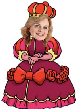
Miss Janet is the queen on Wednesday and Thursday

Toen de prinses Cinderello zag was ze meteen verkocht. Wat een leuke jongen! De hele avond dansten en kletsten ze en Cinderello wilde de prinses net een kus geven toen de klok twaalf sloeg. Halsoverkop verliet hij het feest en rende zo hard weg, dat hij zijn sneaker verloor. De prinses was ontroostbaar. De dag erna ging ze met de boodschapper op weg om de jongen te vinden die de sneaker zou passen. Bij het huis van de stiefmoeder probeerde de wolf nog even de schoen aan, maar dat vonden de stiefzusjes niet zo leuk van hem. De prinses wilde net teleurgesteld weg gaan toen ze iemand hoorde fluiten... Cinderello! De schoen paste hem precies en de prinses vroeg of hij met haar wilde trouwen. Dat wilde hij. Dezelfde dag nog was er een grote bruiloft. Cinderello en de prinses én prins wolf met zijn twee bruiden zeiden allemaal "ja" tegen elkaar. En ze leefden nog lang en gelukkig (tenminste.... Cinderello en zijn prinses wel!)